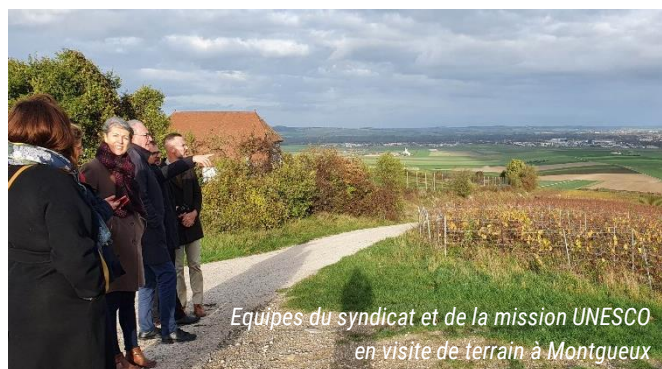
Equipes du syndicat et de la mission UNESCO en visite de terrain à Montgueux

Ce rapprochement pourrait se pérenniser et donner lieu à de nouvelles collaborations (guide, InterSCoT...).